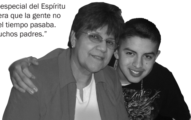
Asistentes en un evento familiar

Marzo. Puerto Arturo, TX: “Gracias amigos por sus cuidados y oraciones por mi familia y ministerio. Este fin de semana tomó lugar una conferencia matrimonial. Hubo una presencia suave y especial del Espíritu Santo, de tal manera que la gente no se movía aunque el tiempo pasaba. Dios restauró a muchos padres.”